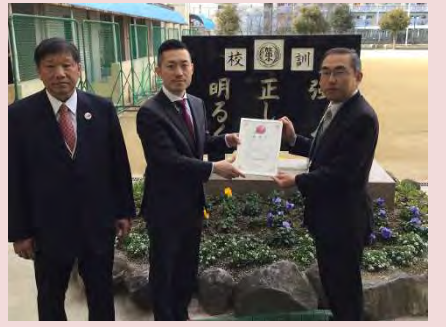
【大阪市立放出小学校】